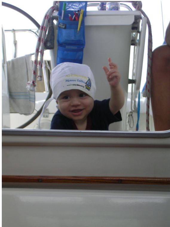
„Smutje! A koits Bier!“

Und weil der, der so hart arbeitet auch an riesen Durst bekommt, testen wir gleich einmal den Bordservice: